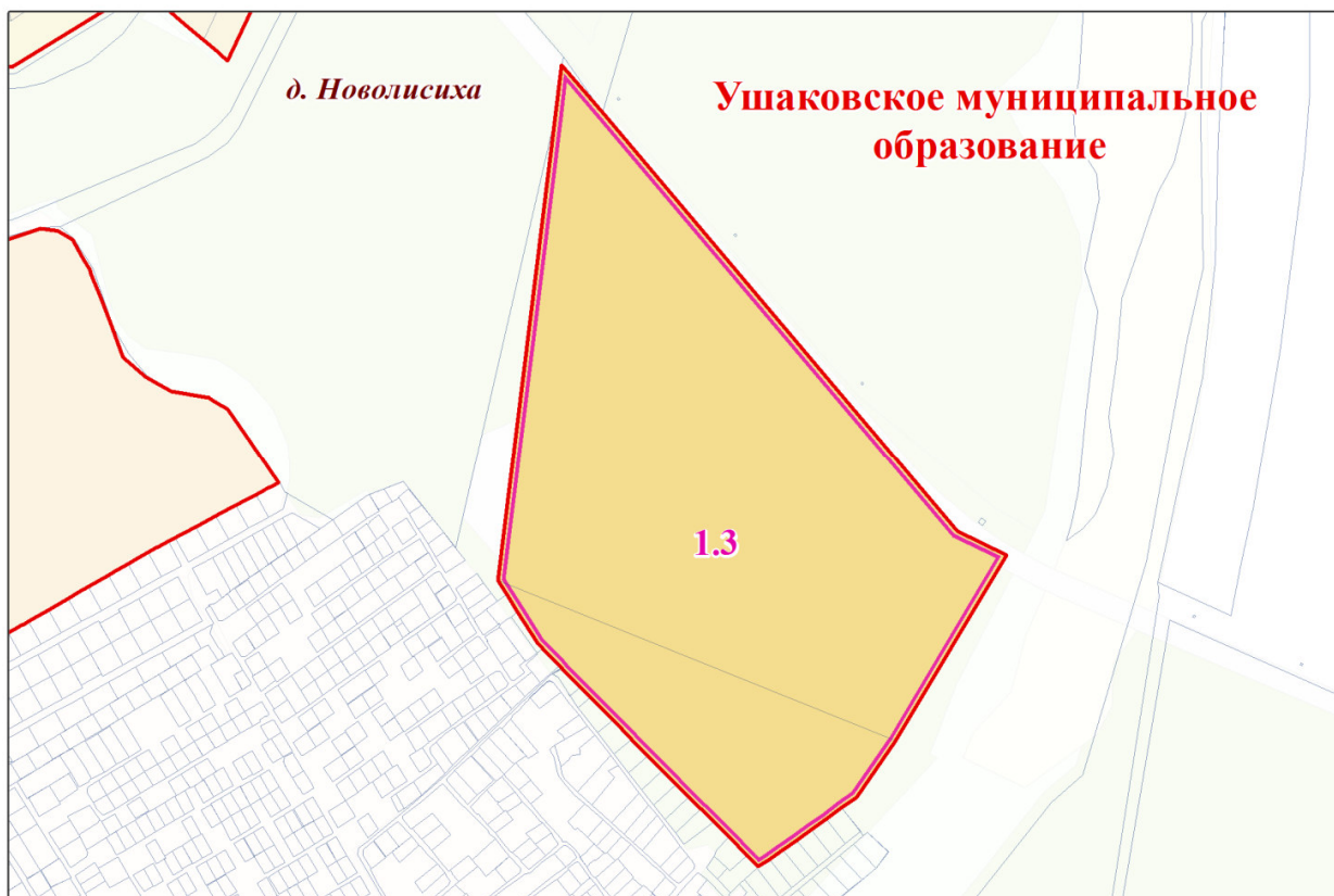
Рисунок 1.3 - Схема с отображением планируемых границ земель различных категорий

Согласно Схеме территориального планирования Иркутского района территория, расположенная восточнее населенного пункта д. Новолисиха и планируемая для ведения дачного хозяйства, садоводства и огородничества, предлагается к переводу земель из земель лесного фонда в земли сельскохозяйственного назначения (Рисунок 1.3).